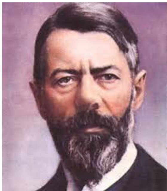
Освальд Шпенглер (1880-1936)